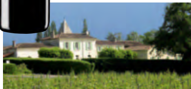
Château La Croix de Roche

*robertparker.com, 25.04.2013 über den Jahrgang 2012