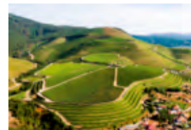
Weinberge Altos de Torona