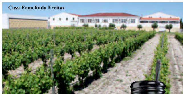
Casa Ermelinda Freitas