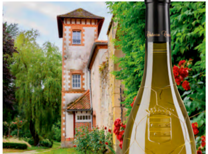
Domaine Chéreau Carré