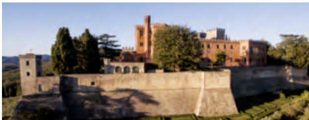
Castello di Brolio